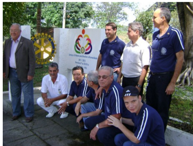
Recepção dos companheiros do R.C.de Rio Pomba ao Governador distrital no Marco rotário.