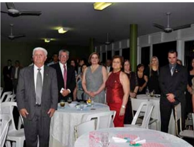
Festiva R.C.de Cataguases-Companheiros do R.C.de Além Paraíba compareceram em 90% na reunião de Cataguases.